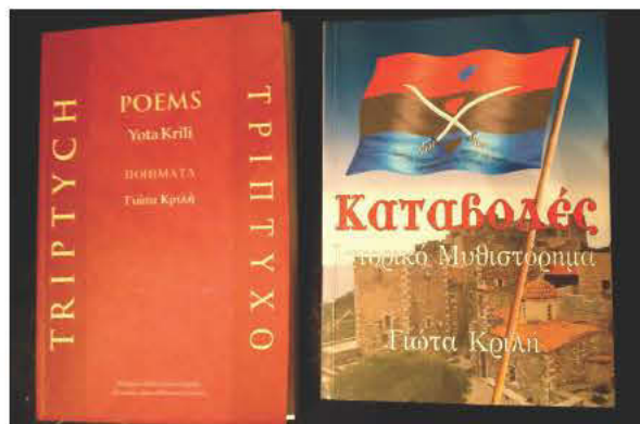
Το εξώφυλλο της δίγλωσσης έκδοσης των ποιημάτων (Τρίπτυχο) και του μυθιστορήματος «Καταβολές»