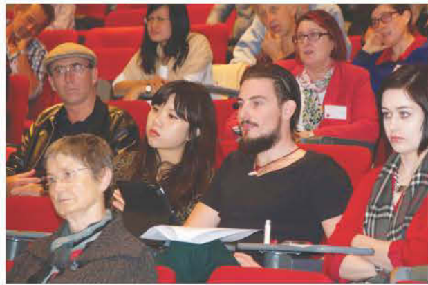
Στο αμφιθέατρο του UTS